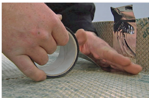
Tejpa samtliga skarvar med dB-Tejp