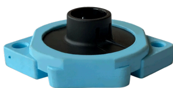
SubFloor Akustik 12

Infästningspunkter SubFloor akustik 12 & 25