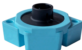
SubFloor Akustik 25