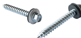
Art. 83510 – Betong-/Träskruv 6,5x51 mm