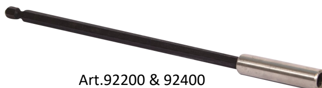
Art.92200 & 92400